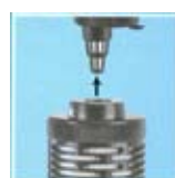
PowerHead 20 / 30