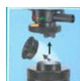
PowerHead 50 / 70