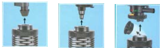
PowerHead 10 PowerHead 20 / 30 PowerHead 50 / 70